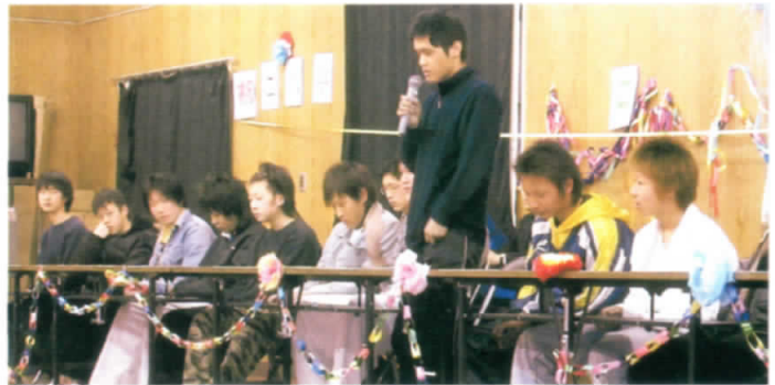
定時制新入生歓迎会 (H18.4.11)

さて、本校定時制は報道されましたように、平成二十年度より屋代南の多部制・単位制に再編される旨の計画が決定されました。今後関連の説明会が開かれる状況です。