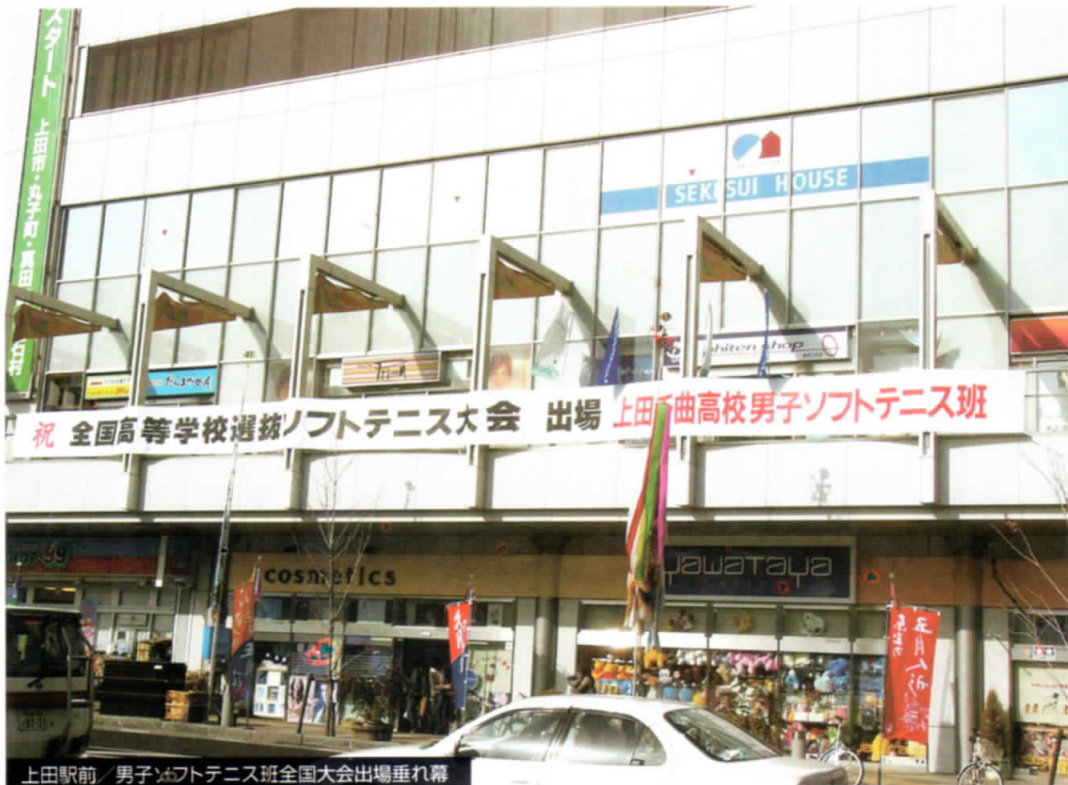
上田駅前 男子ソフトテニス班全国大会出場垂れ幕