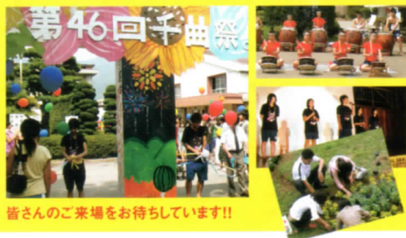
皆様のご来場をお待ちしています!!