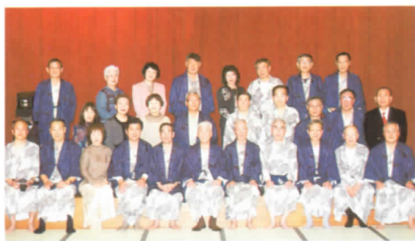
茨城の旅にて(平成18年3月5日・6日)

昭和三五五年機械科(一組)を卒業し、高度成長期と共に歩んできた私達の仲間も、今は多くが第一線を退きましたが、この間「三五桐の会」という名称を付け、地元のほか昇仙峡、能登、柏崎などの旅行も行い旧交を温めてきました。