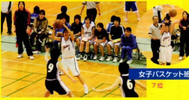
女子バスケット班 7位