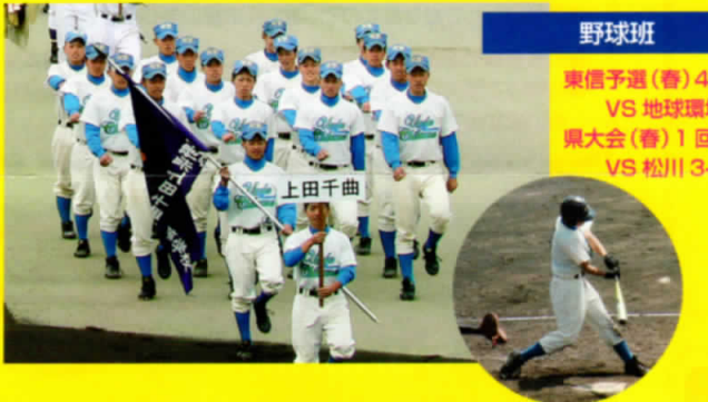
野球班 東信予選(春)4位 VS 地球環境 4-5 県大会(春)1回戦敗退 VS 松川 3-6