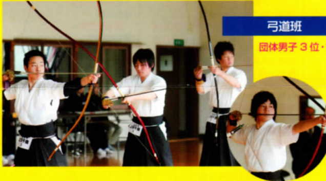
弓道班 団体男子3位・女子3位