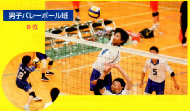
男子バレーボール班 8位