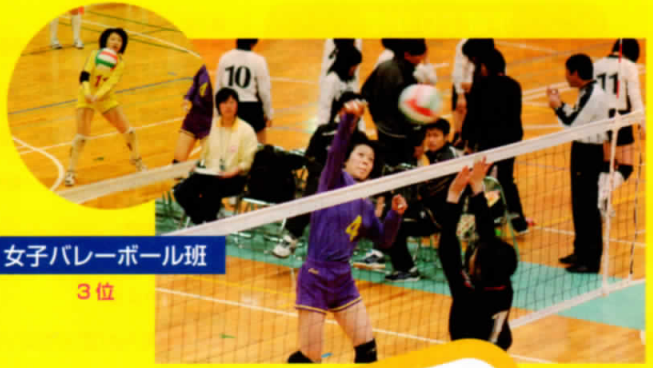
女子バレーボール班 3位