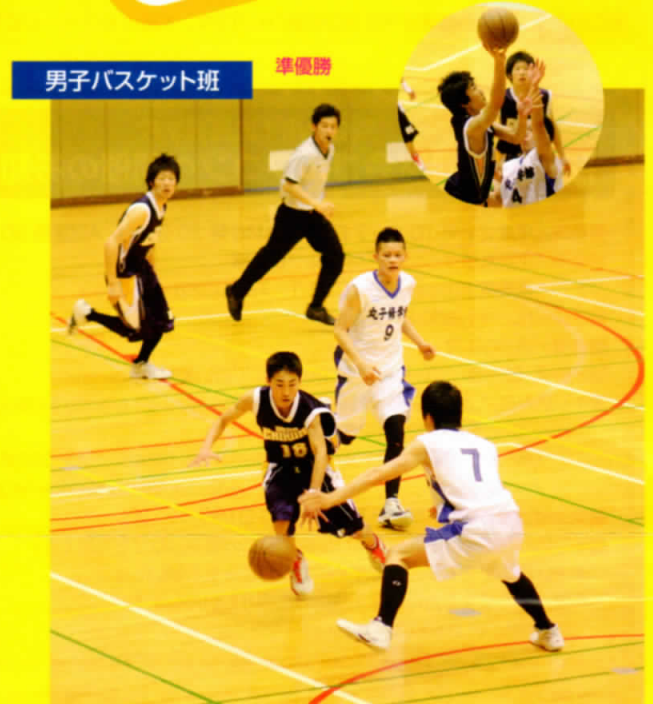
男子バスケット班 準優勝