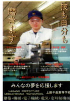
平成20年度/東信地区の中学校向けの宣伝ポスター