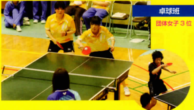
卓球班 団体女子3位