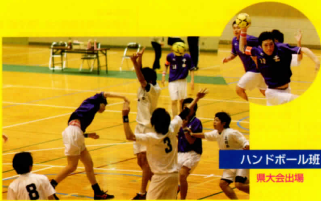
ハンドボール班 県大会出場