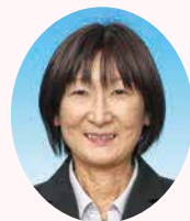
上田千曲高校 教諭

私の高校時代は暗い長いトンネルの中でもがき苦しんだ3年間でした。後にも先にも同窓生で化学の分野に進み、理科の教師になる者はいないと思います。高校受験にまさかの不合格。中学浪人のつもりが、「どうせ浪人するなら、大学受験にしたら」という中学の先生のアドバイスで、機械科に二次募集で入学しました。どういう訳か1年生で1人だけ生徒会書記として当選し、会長はじめとして先輩方にかわいがっていただきました。クラブにも入らず、何としても、普通科の生徒に敗れたくないという異常な執念の塊りでした。当時は今のような国立大学の工業枠推薦がなかったのでもともに勝負するしかありませんでした。2年生からは毎日8時間を目標に家庭学習に取り組みました。化学基礎は1年で2単位学んだだけで、化学は完全に独学するしかありませんでした。ちょっと教えてもらえばわかるどころ、やたらに無駄な時間を費やしました。光の見えない暗闇の受験勉強の中で、苦難と自分自身が向かい合う日々がいつ終わるともなく続きました。幸い現役で信州大学に合格することができました。「あの時の苦しい経験があったからこそ今の自分がある。」と今だからこそ、確信を持って言えます。努力しても報われるとは限らない。しかしたとえ報われなくても努力を継続してきたプロセスは必ず人間を大きく成長させることを生徒の皆さんに伝えたい。