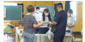
千曲祭 販売実習(ちくまーと)風景