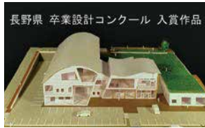
JIA卒業設計コンクール入賞作品