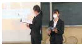
クエストカップ全国大会リモート開催 学校から生配信