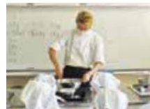
焼き菓子教室(2年・3年)