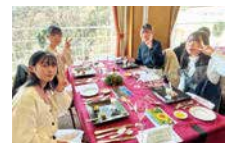
安曇野での研修(3年)