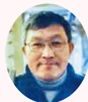
上田千曲高校 教諭

同窓生よりの記事募集 同窓会員の活動・高校時代の思い出等、または推薦していただける方がおられましたら事務局までご連絡ください。