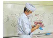
専門学校による授業(2・3年)