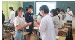
3年 信金出前授業 ビジネス マナー講座 名刺交換しています