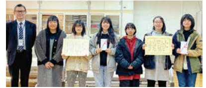
福祉ケアコンテスト受賞者