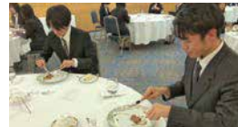
3年 将来のビジネスチャンスのために テーブルマナー講座