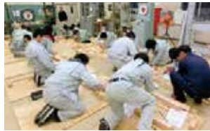
建築科技能検定(国家資格)練習風景

コロナ禍の文化祭を盛り上げるため、建築科の3年生が、100周年記念のアーチと同規模(幅10m高さ5m)の巨大なアーチを制作しました。