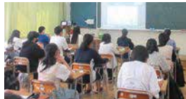
3年 信金出前授業 ビジネス マナー講座 リモート講義受講中