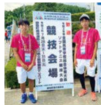
男子ソフトテニス班